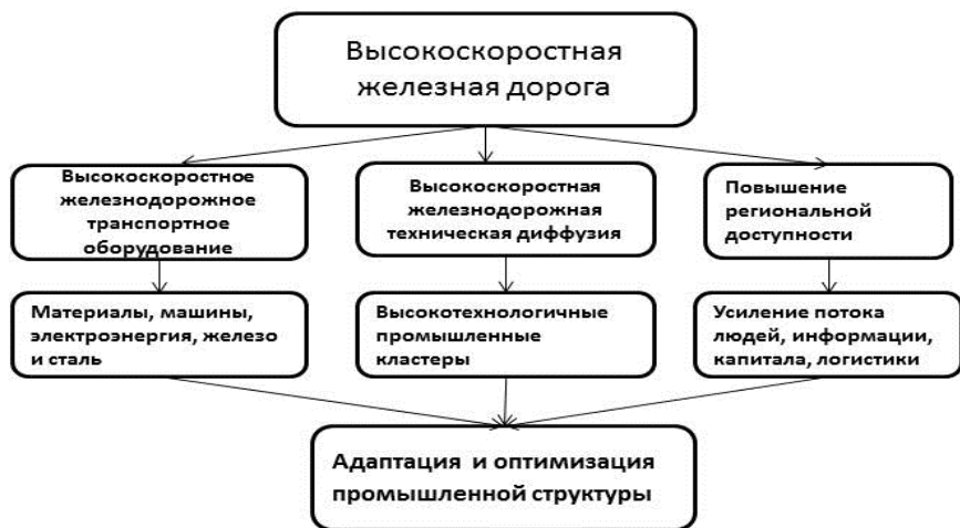
РИСУНОК 1. Воздействие развития высокоскоростной железной дороги на промышленную структуру

С развитием высокопрофессиональной железной дороги происходит постепенное со-развитие региональной промышленной структуры. В качестве новой эффективной транспортировки высокоскоростная железная дорога играет незаменимую роль в обрабатывающей промышленности, в промышленности высоких технологий и третичной промышленности. Согласно теории секторов, или структурных изменений, разработанной в 1930–1940-е гг. Аланом Фишером 9 , Колином Кларком 10 и Жаном Фурастье 11 , экономика делится на три сектора осуществления деятельности: первичный — добыча сырья, сельское хозяйство, некоторые виды промышленности (рыбная, горнодобывающая и лесная), вторичный — все остальное промышленное производство и строительный бизнес, третичный сектор экономики — это сфера услуг, образование и туристический бизнес. С развитием общества происходит смещение